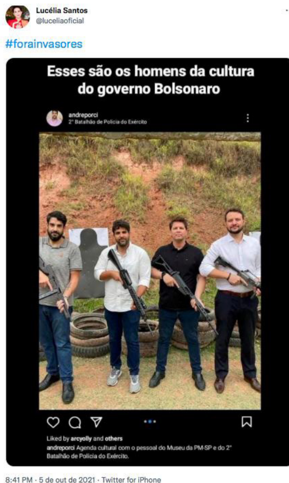
Figura 1. Porciuncula e Frias, ao centro, na imagem reproduzida pela atriz Lucélia Santos