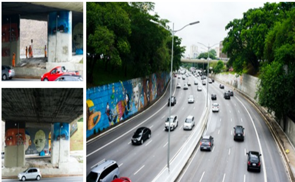
Figura 1. Registro dos apagamentos na Avenida 23 de Maio, em 2017

Ao longo do final de semana de remoções, outras pessoas se dirigiram à Avenida 23 de Maio para registrar o que acontecia, o que também me incluía. As imagens e relatos se proliferaram nas redes sociais, atestando o bom estado de conservação dos murais que não estavam na lista da Secretaria Municipal de Cultura.