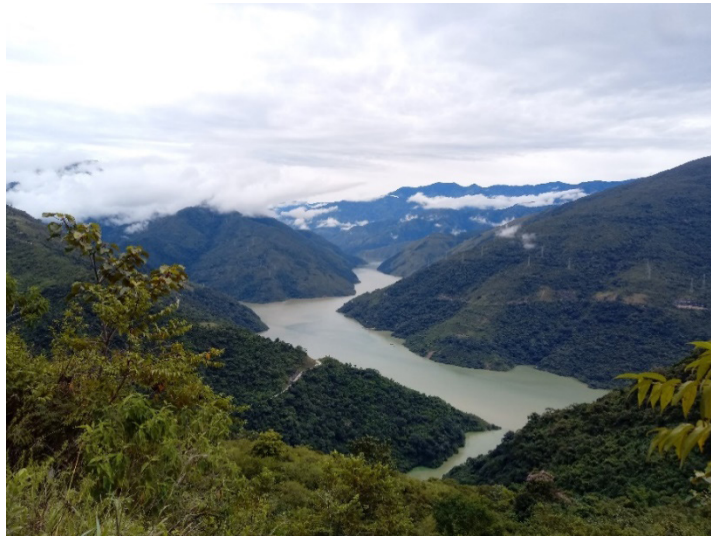
Figura 4 - Río Cauca -Briceño

Nosotros en nuestro río tenemos un patrón que lo llamamos Patrón Mono. Esta es nuestra casa. Se la agradezco a ese Patrón Mono, mis hijas han tenido estudio y lo necesario para sobrevivir gracias a ese Patrón Mono y vivimos de un signo vital y una fuente hídrica que se llama agua que es vida (INSTITUTO DE ESTUDIOS REGIONALES DE LA UNIVERSIDAD DE ANTIOQUIA, 2017).